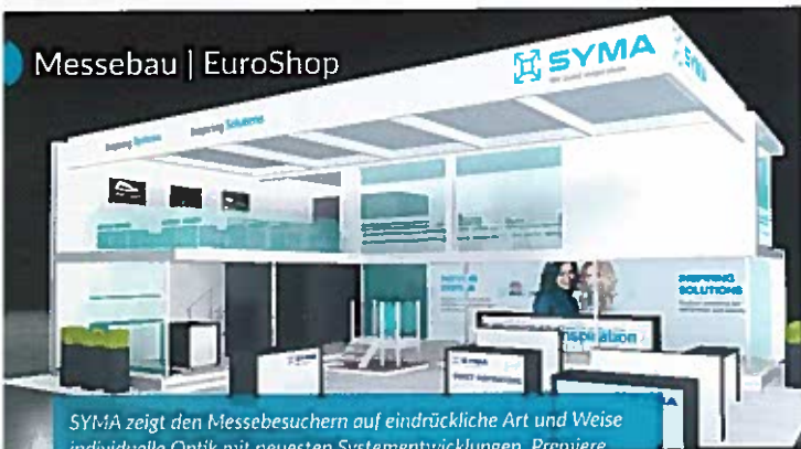
SYMA zeigt den Messebesuchern auf eindruckliche Art und Weise individuelle Optik mit neuesten Systementwicklungen. Premiere feiern die SYMA-TEXWALL und als Überdachung SYMA-SKY.