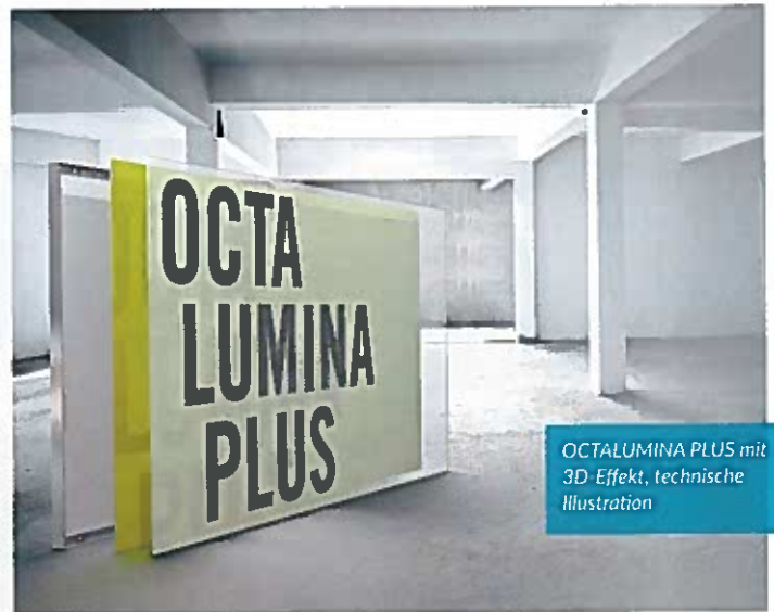
OCTALUMINA PLUS mit 3D Effekt, technische Illustration

Zum 17. Mal nimmt die 1968 gegründete OCTANORM-Vertriebs-GmbH an der EuroShop teil. Das Filderstädter Unternehmen präsentiert sich gemeinsam mit seiner Tochterfirma EXPOMOBIL in Halle 5, auf den Ständen E 05, E21 und E18 auf über 470 m 2 . Für den Messestand, der wie immer auch zugleich Exponat unter Einbindung der neuen Produkte ist, hat sich OCTANORM das renommierte und international erfolgreiche Architekturbüro Ippolito Fleitz Group ins Boot geholt. Highlight der diesjährigen Messe ist ein komplett neues Messebausystem. Daneben komplettieren vielversprechende Erweiterungen bestehender Produktfamilien – z. B. die Leuchtrahmensysteme OCTALumina, das überarbeitete Wandsystem OCTAWall 40 Stoff und Panel, das Trägersystem OCTARig sowie zwei neue Doppelbodensysteme, letztere gemeinsam mit EXPOMOBIL – das Angebot. Eine weitere Attraktion ist die geplante VR-Integration in das Software-Produkt OCTAdesign, die auf dem Stand hautnah miterlebt und getestet werden darf. Eine große Bar und ein Lounge-Bereich laden zum Verweilen und zu interessanten Gesprächen ein.